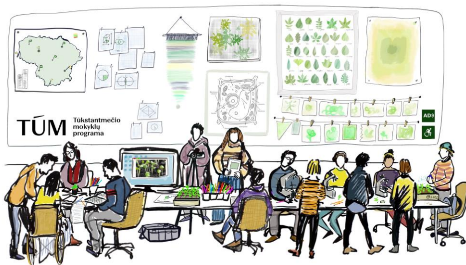
Medilės Šiaulytės iliustracija.